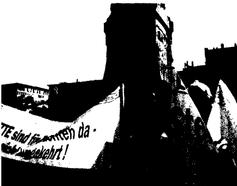
Helga Liedtke und Rudi Krebsbach bei der Demonstration der DGHS beim Deutschen Ärztetag.