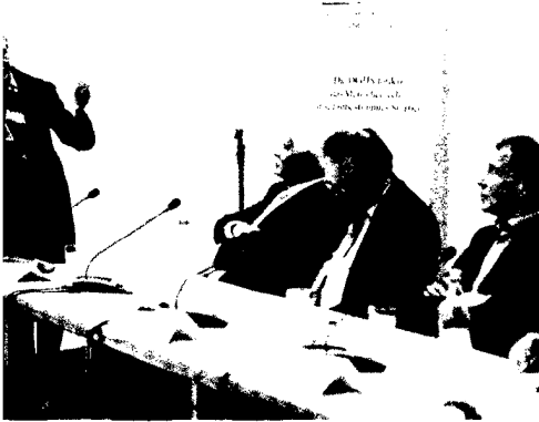
DGHS-Präsidentin Elke Baezner mit den Top-Juristen am 21. April 2015 in Berlin.