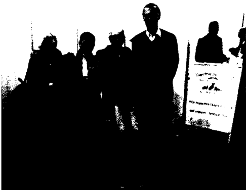
Dem DGHS-Stand eine leere Fläche: Die Messe "Leben und Tod" verweigerte einen Standplatz.