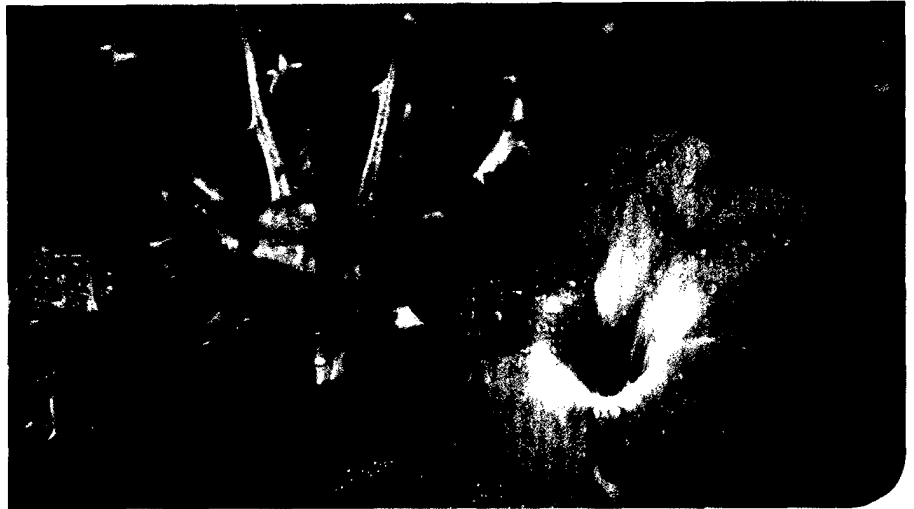
Titelfoto: Teufelskralle ( Harpagophytum procumbens ) in Zambia

*Nahrungsergänzungsmittel. ** Kasten los aus dem deutschen Fest- und Mobilfunknetz Verzehrempfehlung: 1 Tablette pro Tag zu oder nach den Mahlzeiten, um eine optimale Aufnahme der Nährstoffe zu gewährleisten. Überschreiten Sie nicht die empfohlene Verzehrempfehlung von 1 Tablette pro Tag. Nahrungser- gänzungsmittel sollten nicht als Ersatz für eine ausgewo- gene und abwechslungsreiche Ernährung dienen. Achten Sie auf eine gesunde Lebensweise. ArmoLipid darf nicht in der Schwangerschaft, Stillzeit oder zusammen mit Arzneimitteln zur Senkung der Blutfette (Choleste- rinspiegel) verwendet werden. Das Produkt außerhalb der Reichweite von kleinen Kindern lagern. ArmoLipid ist glutenfrei. MEDA Pharma GmbH & Co. KG Benzstraße 1 DE-61352 Bad Homburg MEDA