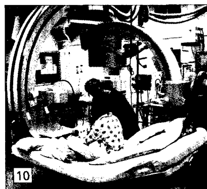
Entree.wikimedia (7) ROY MEDIC AI INC