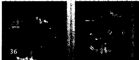
Fissurenversiegelung mit Durchblick. Transparentes Material macht es möglich.