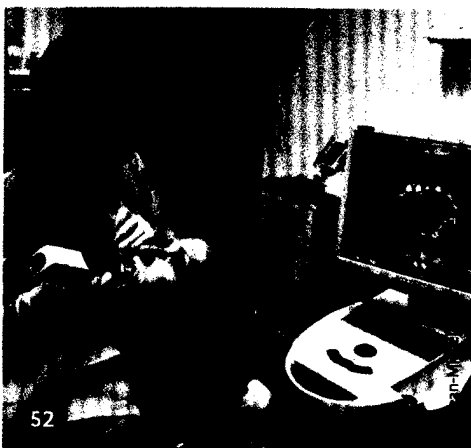
Mit CEREC-Schulungen für die Assistenz gelingt die Integration des digitalen Workflows in den Praxisalltag.