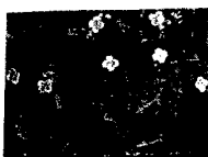
ARS MEDICI 7/15: Leoparden, Vögel (verkauft!)