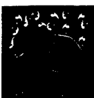
ARS MEDICI 8/15: Elefant mit Jungem (verkauft!)