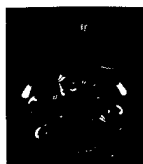
ARS MEDICI 10/15: Vögel auf schwarz (verkauft!)