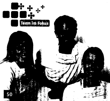
Team im Fokus: Ihr Weg zur interdisziplinären Mundgesundheitspraxis, jetzt per Fax anmelden.