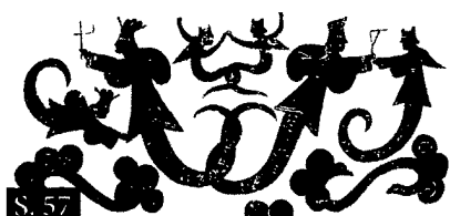
S. 57 Ulla Blum Acht Brokate