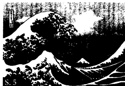
S. 5 Andreas Noll Was heißt „alt“ und was geschieht ab 50 mit dem Qi?