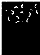
ARS MEDICI 9/15: Vögel auf Grün (verkauft!)