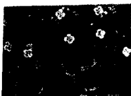
ARS MEDICI 7/15: Leoparden, Vögel (verkauft!)