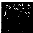
ARS MEDICI 8/15: Elefant mit Jungem (verkauft!)