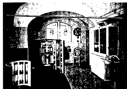
Foto: ©Bresler J. Deutsche Heil- und Pflegeanstalten in Wort und Bild, Halle an der Saale: Carl Marold 1912. Raum für Licht- und Elektrotherapie in Dr. Weilers Kuranstalten in Berlin-Westend, eröffnet 1910