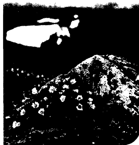
Titelfoto: Blutwurz (Potentilla erecta)