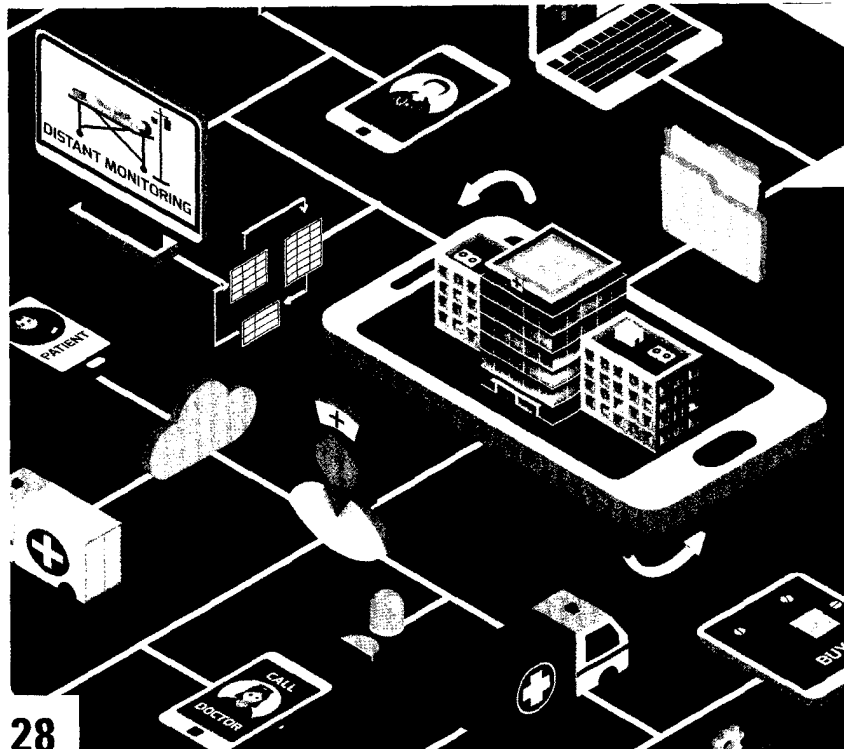
Im Pflegebereich sind verstärkt berufsübergreifende IT-Systeme am Point of Care gefragt.