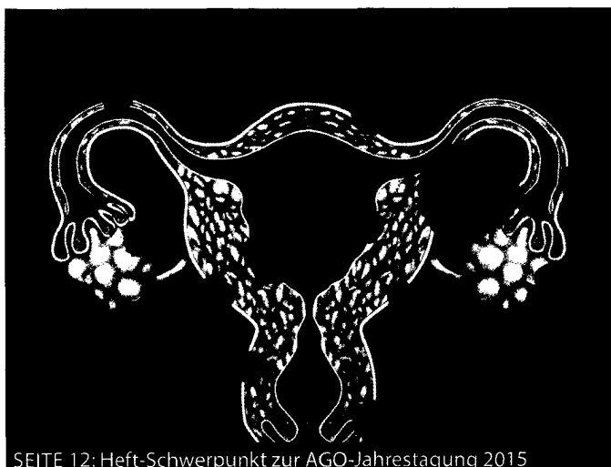
SEITE 12: Heft-Schwerpunkt zur AGO-Jahrestagung 2015