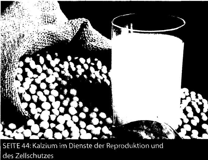
SEITE 44: Kalzium im Dienste der Reproduktion und des Zellschutzes