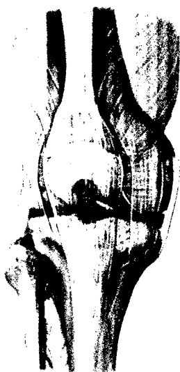
Bild: Schünke M., Schulte E., Schumacher U., Prometheus. LernAtlas der Anatomie. Allgemeine Anatomie und Bewegungssystem. Illustrationen von M. Voll und K. Wesker. 3. Aufl. Stuttgart: Thieme; 2011

Verletzungen des vorderen Kreuzbands erhöhen langfristig das Arthroserisiko. (S. 10)