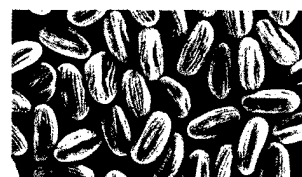
Pollen vom Einblatt ( Spatiphyllum sp. ), Vergrößerung 700-fach