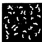
ARS MEDICI 1/15: Paradiesvögel blau (verkauft!)