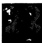
ARS MEDICI 2/15: Giraffen rot (verkauft!)