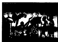
ARS MEDICI 4/15: Buschpraxis