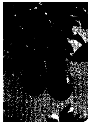
Titelfoto: Avocado-Früchte am Baum ((Persea americana MILL., Persea gratissima))