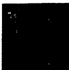
ARS MEDICI 2/15: Giraffen rot (verkauft!)