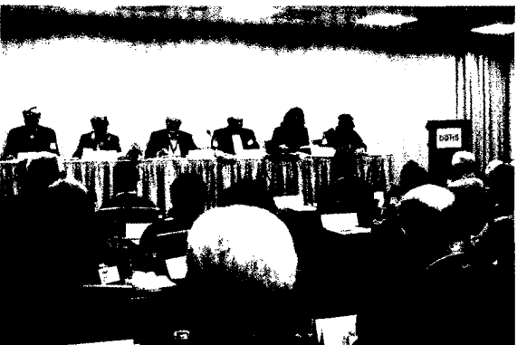
Intensive Arbeit während der Delegiertenversammlung.