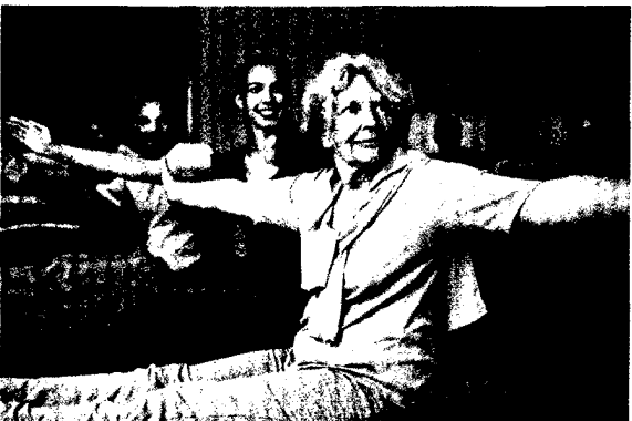
Alltagsfunktionen zu stärken ist das Ziel einer geriatrischen Reha.