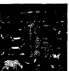
ARS MEDICI 21/15: Tiere, Abendrot (verkauft!)