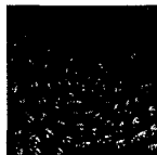
ARS MEDICI 22/15: Fischwirbel (verkauft!)