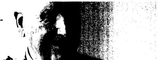
Mehnerts Diabetes- Tipps