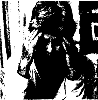
Wenn Frauen keine Worte finden, ist Vorsicht vor Demenz geboten

Ekblad LL et al.: Insulin resistance is associated with poorer verbal fluency performance in women. Diabetologia 2015; 58(11): 2545-53