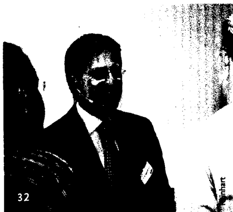
Meet the Experts: Das dent update-Konzept überzeugte auch in Runde zwei.