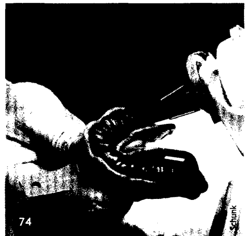
Abrechnung: Ärgerliche Diskussionen mit beihilfeberechtigten Patienten vermeiden