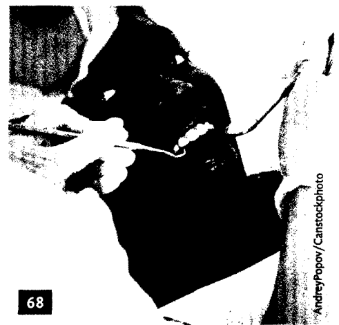
Sprachprobleme und Kostenerstattung: Aktuelle rechtliche Hinweise zur Behandlung ausländischer Patienten