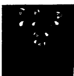
ARS MEDICI 18/15: Paradiesvögel auf Hellblau (verkauft!)