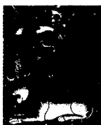
ARS MEDICI 20/15: Löwe und Pfau (verkauft!)