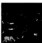
ARS MEDICI 21/15: Tiere, Abendrot (verkauft!)