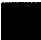
ARS MEDICI 19/15: Perlhühner auf Orange (verkauft!)