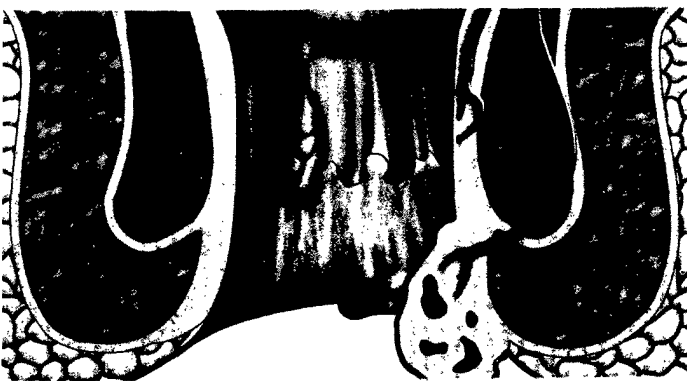
23 Hämorrhoidalleiden wirksam therapieren