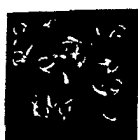
ARS MEDICI 16/15: Vögel auf Blau