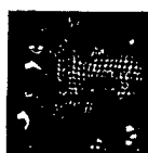
ARS MEDICI 17/15: Leoparden auf Rot (verkauft!)