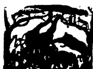
ARS MEDICI 14+15/15: Tiere auf Braun (verkauft!)