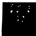
ARS MEDICI 18/15: Paradiesvögel auf Hellblau (verkauft!)