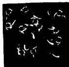
ARS MEDICI 16/15: Vögel auf Blau