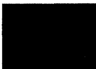
ARS MEDICI 13/15: Chamäleons