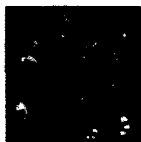
ARS MEDICI 17/15: Leoparden auf Rot (verkauft!)