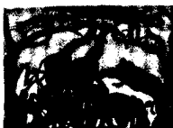
ARS MEDICI 14+15/15: Tiere auf Braun (verkauft!)