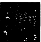
ARS MEDICI 17/15: Leoparden auf Rot (verkauft!)