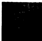
ARS MEDICI 19/15: Perlhühner auf Orange