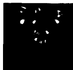
ARS MEDICI 18/15: Paradiesvögel auf Hellblau (verkauft!)