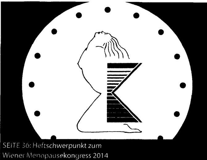
SEITE 36: Heftschwerpunkt zum Wiener Menopausekongress 2014