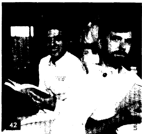
In einer Berliner Zahnarztpraxis können Patienten im Wartezimmer Bücher kaufen. 200 Stück stehen zum Schmökern bereit.