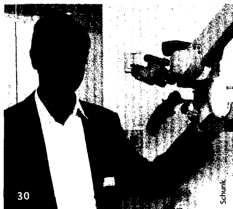
Ein Praxismodell mit Vorbildcharakter: Wurzelkanalbehandlungen und endodontologische Chirurgie auf höchstem Niveau bieten sechs Spezialisten in Frankfurt am Main.