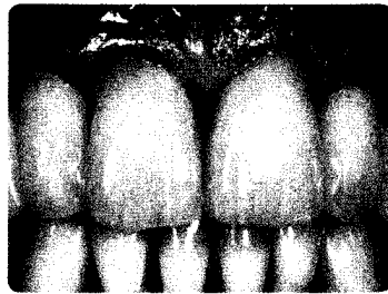
Im Fokus: Schnittstelle Parodontologie und Prothetik