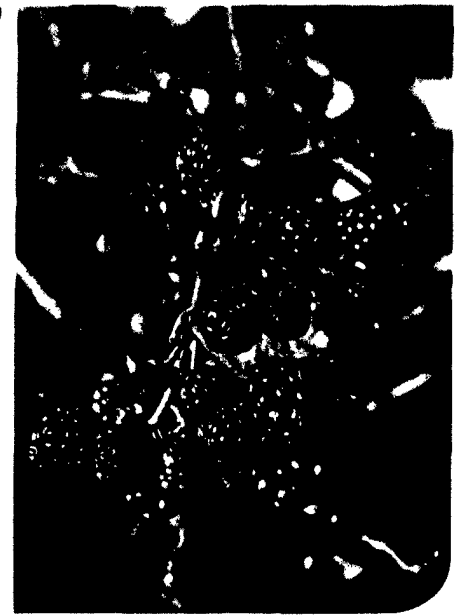
Titelfoto: Brombeeren ( Rubus sectio Rubus )

Bitte beachten Sie, dass die Informationen in dieser Zeitschrift nur als Orientierung dienen und keine ärztliche Beratung ersetzen. Bei Fragen wenden Sie sich bitte an Ihren Apotheker.