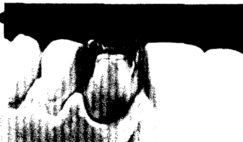
An einem Patientenfall wird die Versorgung mit einer Einzelzahnrestauration im Frontzahnbereich gezeigt. Trotz abgedunkeltem Stumpf erwies sich zirkonoxidverstärktes Lithiumsilikat hierfür als geeignet.