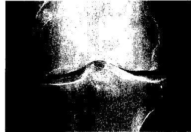
Bild: Wülker N, Hrsg. Taschenlehrbuch Orthopädie und Unfallchirurgie. Thieme 2010

Bei Kniegelenksarthrose können pathologische Bewegungsmuster die Erkrankung fördern. (S. 18)