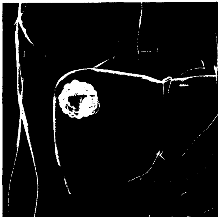
Lebermetastasenresektion: Was ist sinnvoll? ▶ S. 351