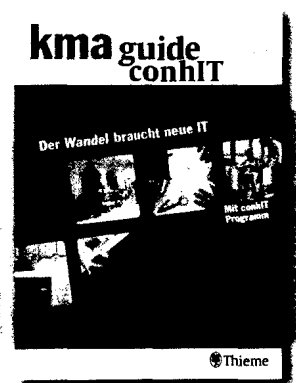
Foto: kmg-kontraste (Personen) Doelfs Illustration: kma/Wiedermann