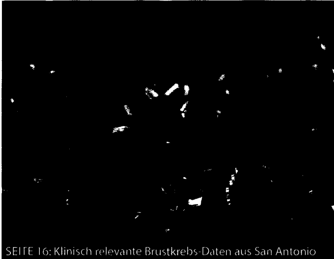
SEITE 16: Klinisch relevante Brustkrebs-Daten aus San Antonio