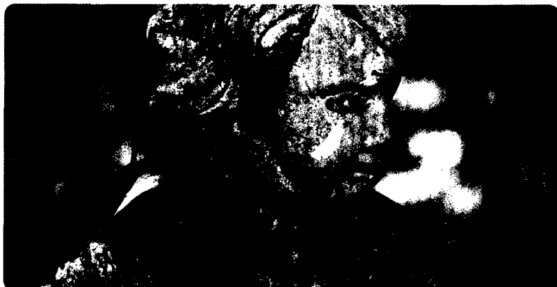
Titelseite