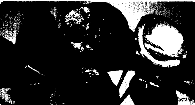
Titelseite: Bearbeitung: Anita Hohler, Pflaum Verlag; Foto: „Kastanie“, Karl F. Liebau