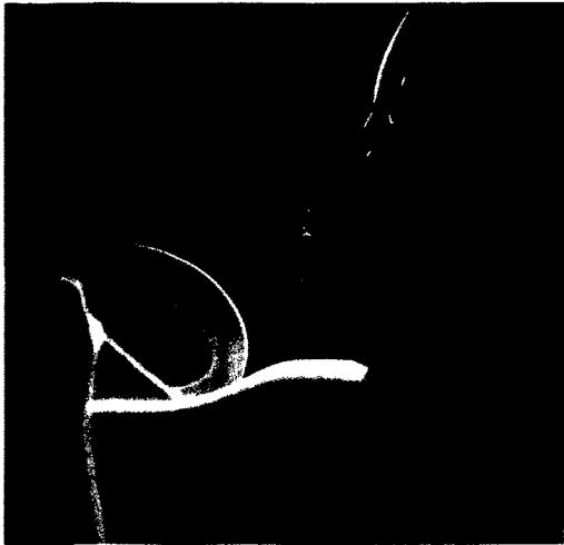
8 Autistische Störungen sind auf punktuelle Fehler bei der Schichtenbildung des Kortex im Mutterleib zurückzuführen.