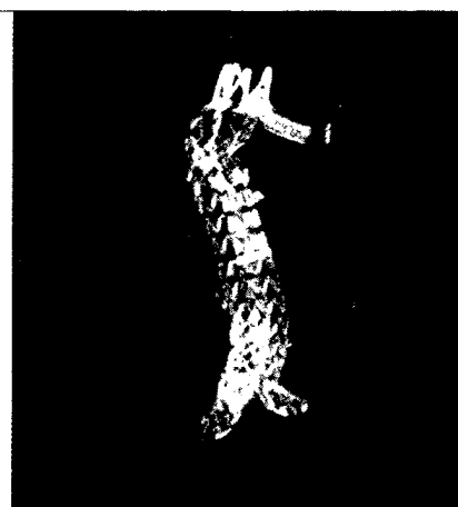
„Lining“ des implantierten Chimney-Grafts ► Seite 205