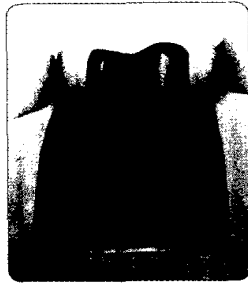
Patientenindividuelles Atlantis CAD/CAM- Abutment