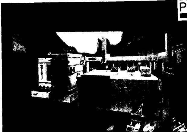
Mit einer automatisierten SPE-Probenvorbereitung gelingt die Pestizidanalyse sensitiv und schnell. Seite 34