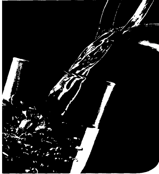
Titelfoto: Wasser (H 2 O, Aqua)