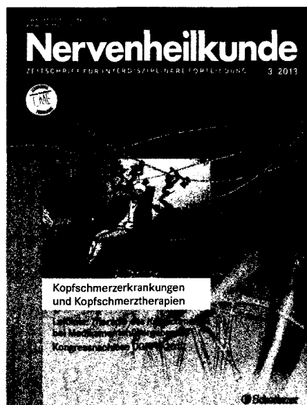
Ihr Lieblingstitelbild 2013