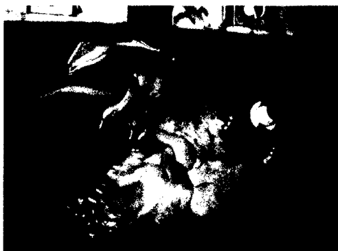
Akute Lungenembolie und zentrale Thrombuslast ► Seite 24