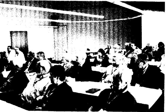
Kreatives Brainstorming und Weiterbildung: Unsere Ehrenamtlichen auf dem Forum 2013.