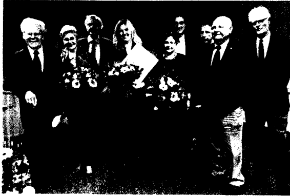
Die Arthur-Koestler-Preisverleihung: Journalisten und ein prominenter Kirchenkritiker zu Gast bei der DGHS.