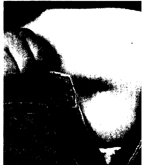
364 Mikrobiomforschung Adipöse Menschen besitzen eine andere Darmflora als schlanke. Ist das die Ursache für ihre Fettsucht?