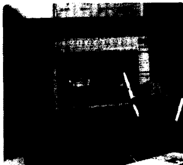
Patientenberatung mit NobelClinician Seite 448