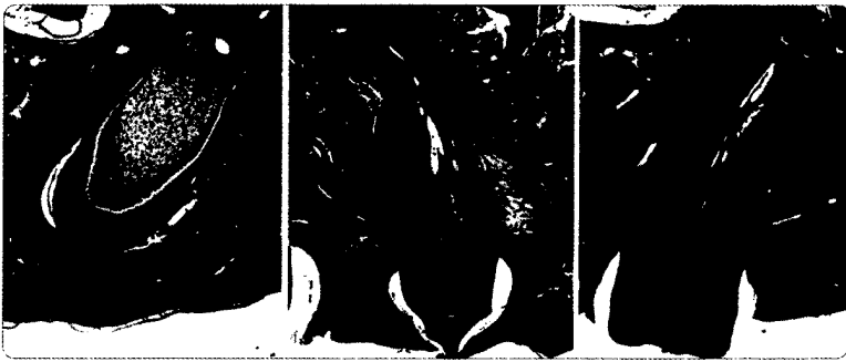
Vom Salamanderarm zum Menschenzahn: Aktueller Stand und Einsatzgebiete der Stammzelltherapie Seite 456