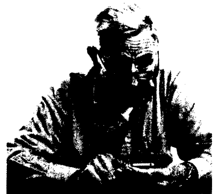
Die intelligente Schuhsohle