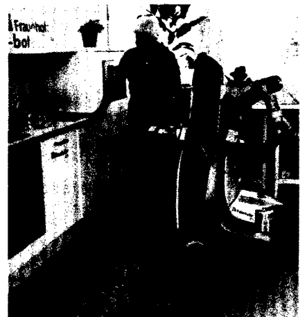
News – Roboter als Helfer