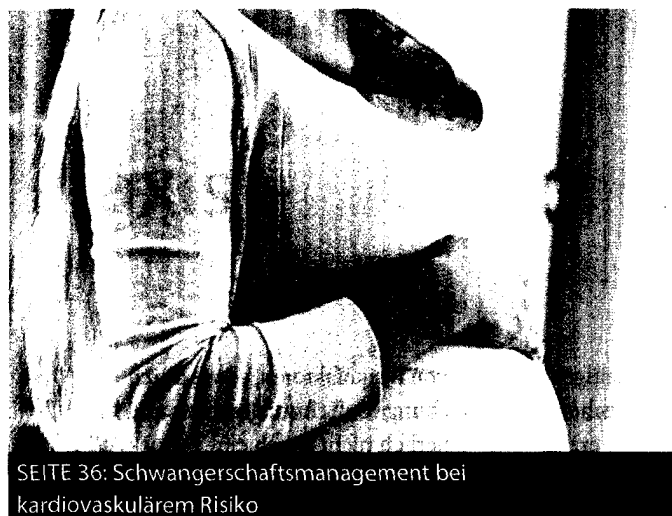
SEITE 36: Schwangerschaftsmanagement bei kardiovaskulärem Risiko